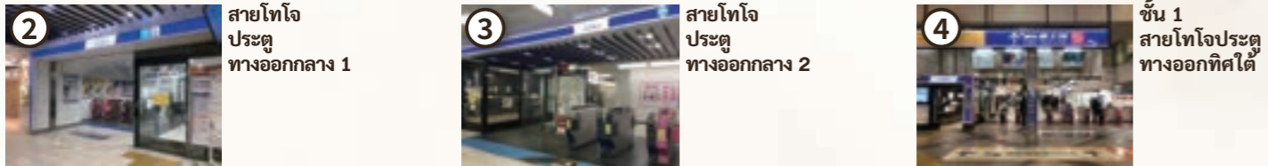
*จุดออกตัวที่ (2), (3) และ (4) รับเฉพาะเงินสด